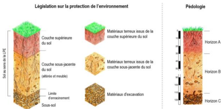
Figure 2 : Définitions du sol

Provenance (lieu, no parcelle) : A définir